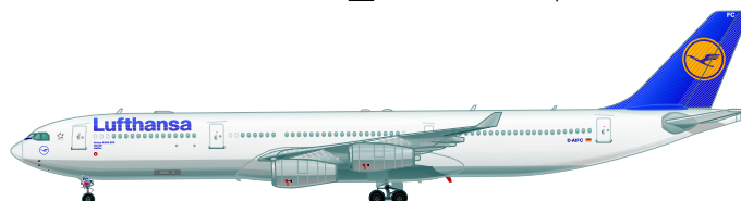
Die abgebildete Sitzanordnung entspricht der Mehrzahl der bei Lufthansa eingesetzten Maschinen dieses Typs, Abweichungen sind möglich. The configuration shown is the one used in most of the Lufthansa Aircraft of this type, deviations are possible.